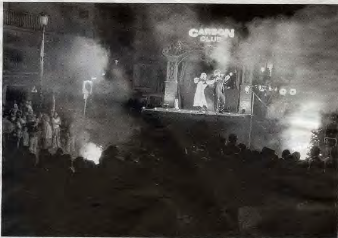
MARKELIÑE. La Plaza de la Tejera se llenó a rebosar para ver el espectáculo "Carbón Club".

en número de espectáculos ofrecidos, catorce, y en asistencia de espectadores. En algún momento de la jornada funcionaron cuatro escenarios de forma simultánea. Mientras The Bernibrothers hechizaban al público en la calle Doctor Muñoz con su humor de altos vuelos, Dedodeporras programaban innumerables obritas de teatro de cinco minutos de duración, aptas para ser vistas de forma simultánea por sólo dos espectadores. Mientras, los niños disfrutaron con La Macana linarense,