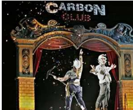
Miners chuck confetti around at Carbon Club

MINERS don't go to heaven when they die – they step out of the dark into the light of the Carbon Club .